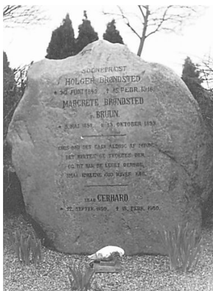
Gravstenen på Tryggelev kirkegård