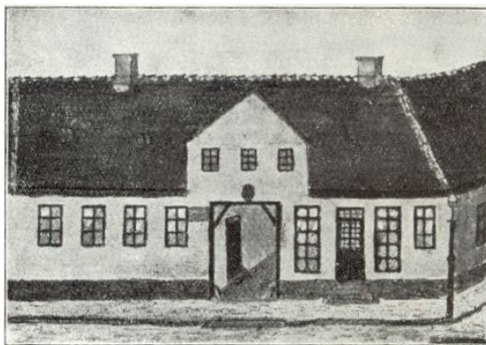
Postgården set fra Smedestræde 1774 [190]