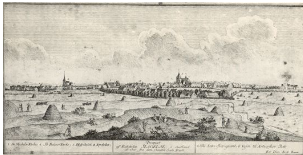
Prospekt af Slagelse fra JJ Bruun: Novus Atlas Danicum.

Gift med Anna Cathrina Basballe. 9 børn, dog kun 2 med efterslægt (Ostenfelt og Bruun). Efterslægt (9 børn) afsn. 2.4.