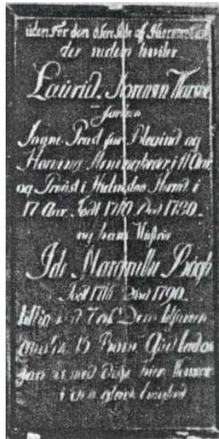
Trætavle for ægteparret i Blegind kirke.