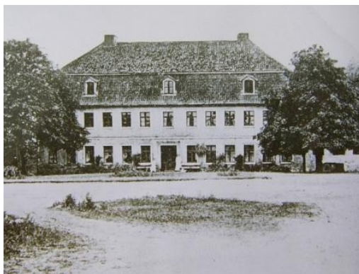
Godset Kogel ("de Cowale") ved Ratzeburg i det. 17. årh.

Hans hustru XVI.42625 (forslægt ukendt):